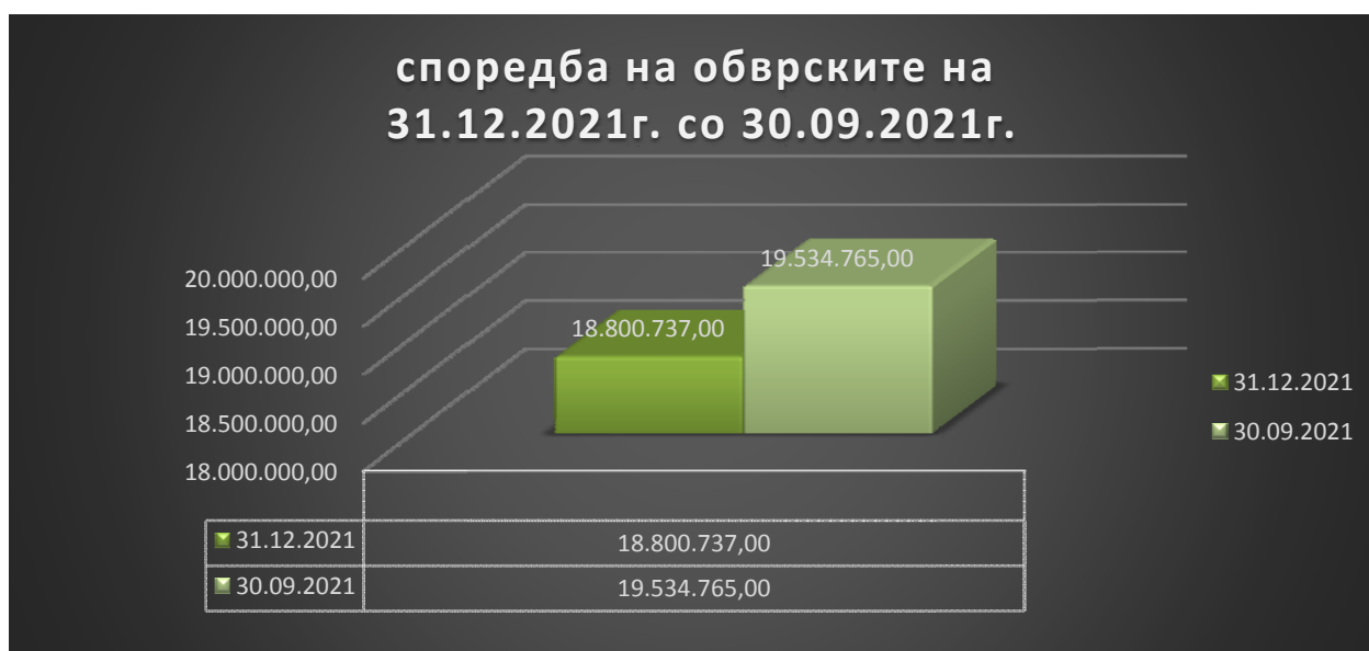
График бр. 3 според табела бр.5

На 31.12.2021 година вкупните парични средства на сите денарски жиро сметки изнесуваат 3.330.021,50 денари , а додека на девизната жиро сметка износот е 2.349.267,00 денари со противредност. На ДООЕЛ Терминал дадена е позајмица во износ од 55.013,00 денари.