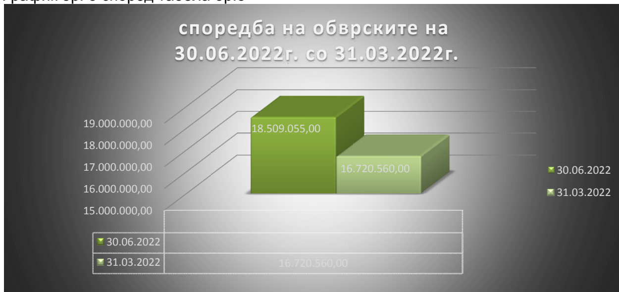
График бр. 3 според табела бр.5