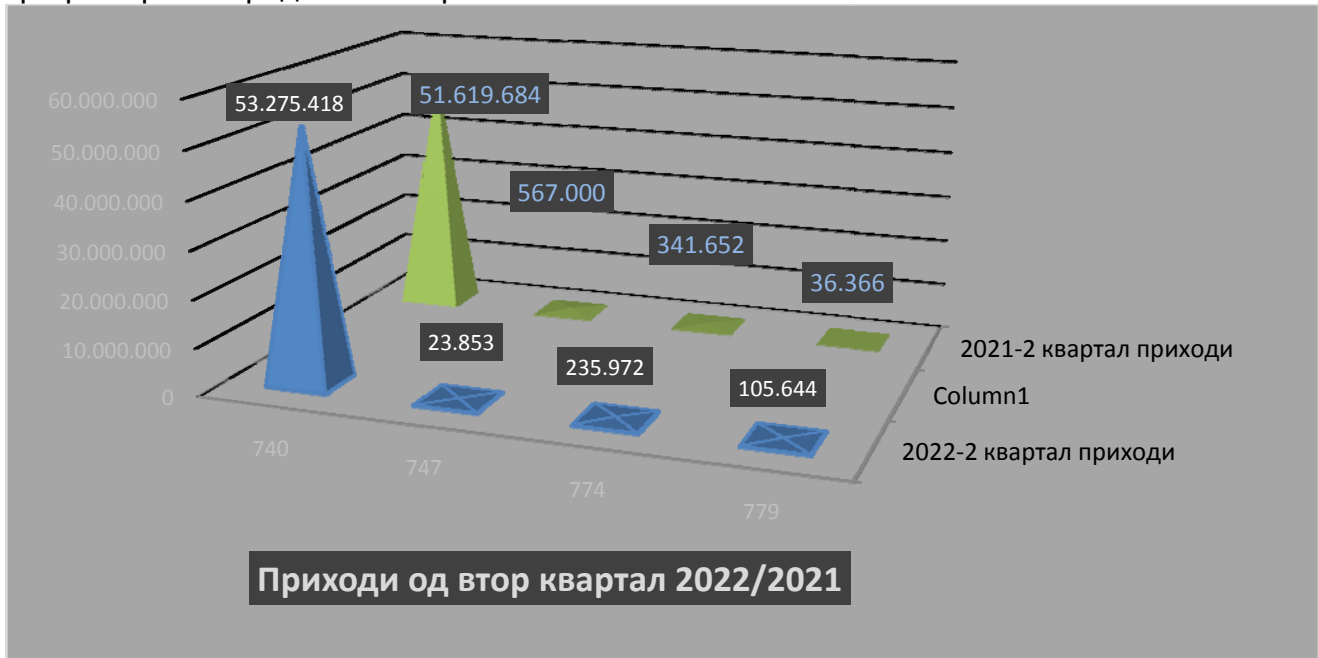
График бр.1 според табела бр.1

Како краен резултат ,приходите од двата разгледувани квартали од 2022г. и 2021г. се разликуваат за 2% или 1.076.185,50 ден.