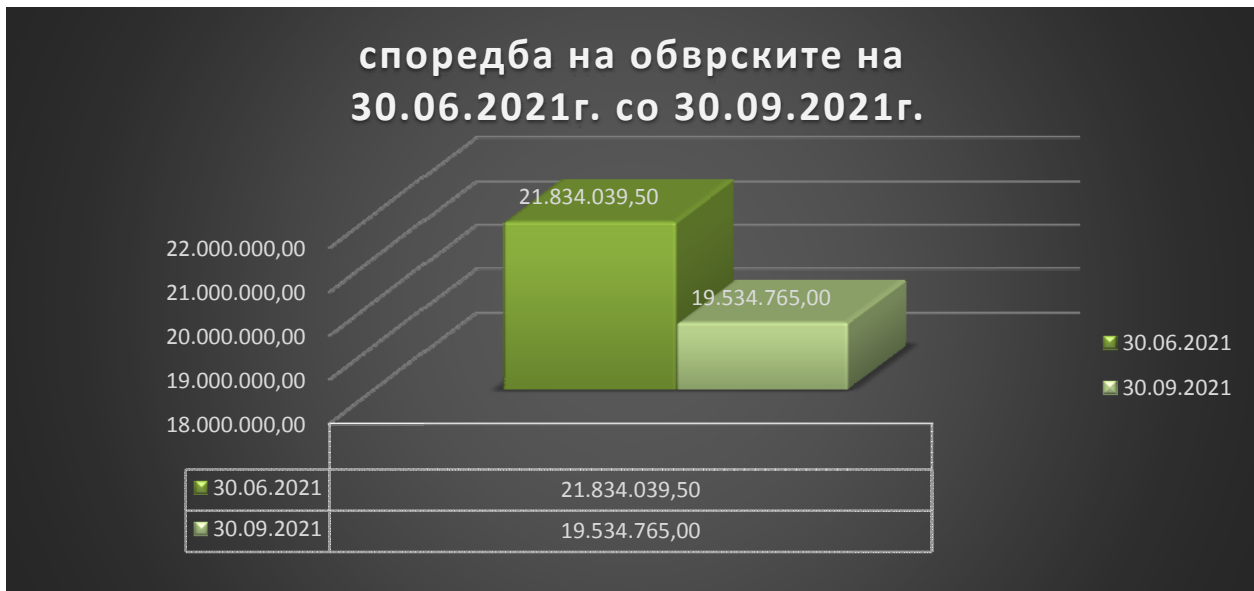
График бр. 3 според табела бр.5

Во период од 01,07,2021г. до 30,09,2021г. обврските за редовното ДДВ се плаќаат редовно, а исплатен е вкупен износ од 1.247.398,00 ден. во овој квартал, додека долгорочните обврски по основ на репрограмирано ДДВ се намалени за 150.000,00 во овој квартал, а за данок од добивка во овој квартал од 2021г. исплатен е вкупен износ од 392.344,00 ден.