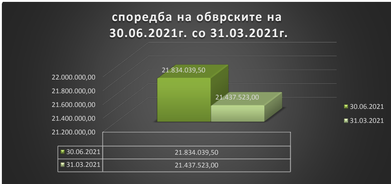
График бр. 3 според табела бр.5

Во период од 01,04,2021г. до 30,06,2021г.обврските за редовното ДДВ се плаќаат редовно, а исплатен е вкупен износ од 1.597.388,00ден.во овој квартал, додека долгорочни обврски по основ на одложено плаќање на репрограмирано ДДВ до крајниот рок на исплаќање со 2023 година изнесува 23.339.224,00 денари главен долг., а за данок од добивка во овој квартал од 2021г. исплатен е вкупен износ од 388.393,00 ден.