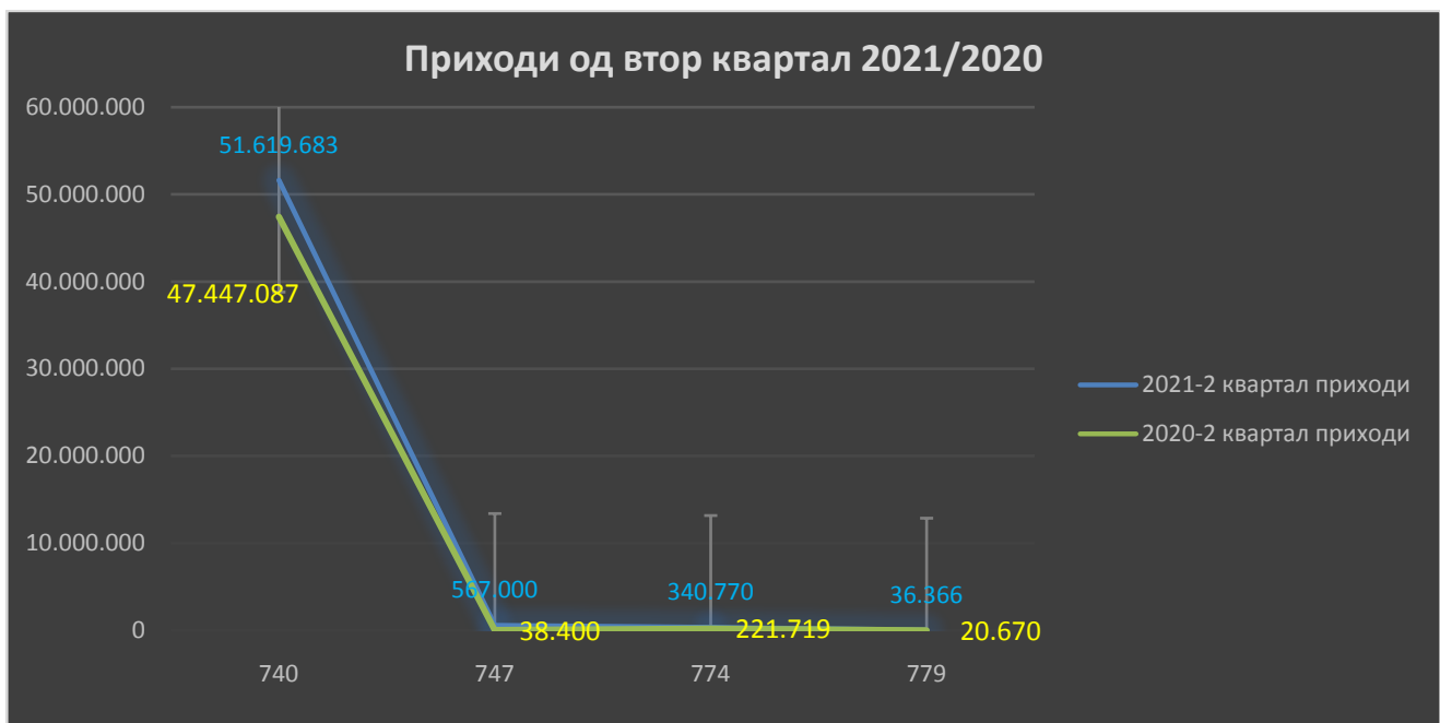
График бр.1 според табела бр.1

Како краен резултат ,приходите од двата втори квартали од 2021г. и 2020г. се разликуваат за 10% или 4.835.944,00 ден.