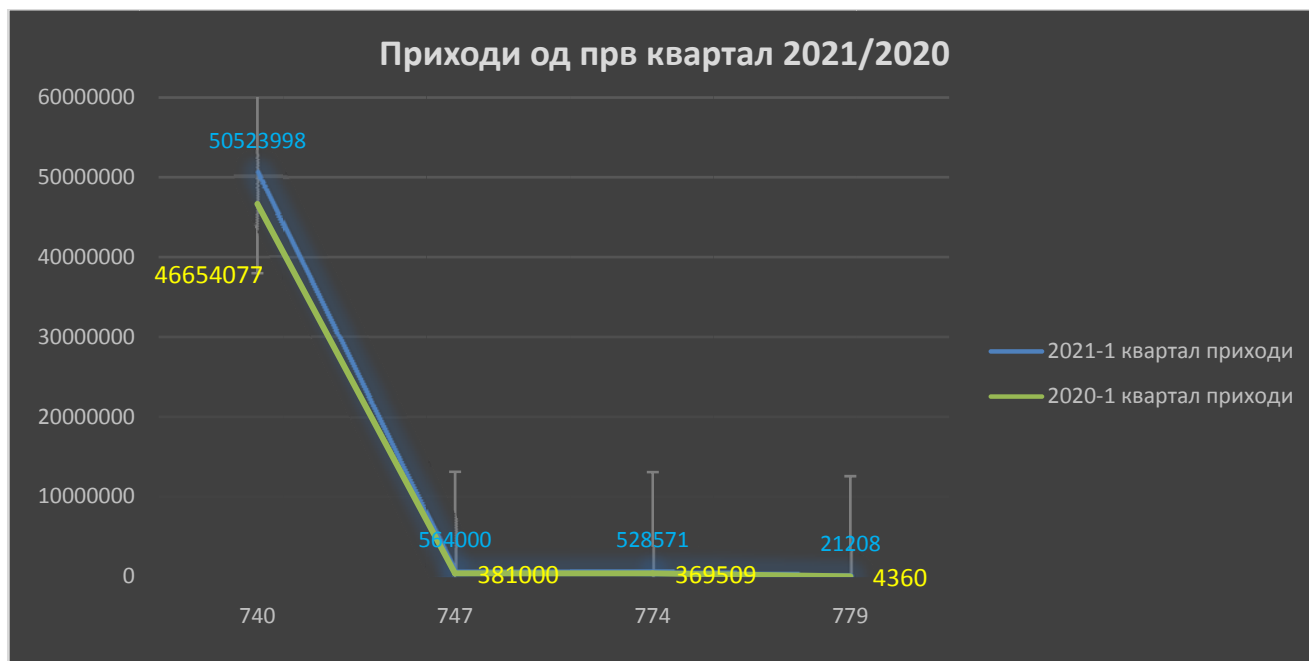
График бр.1 според табела бр.1

Како краен резултат ,приходите од двата први квартали од 2021г. и 2020г. се разликуваат за 8,9% или 4.228.831,00 ден.